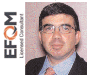
European Quality Award Assessor Titolare EQM Consulting

E uscita la pubblicazione ufficiale della nuova norma BSI PAS 99:2006 - PUBLICLY AVAILABLE SPECIFICATION - che copre un vuoto normativo esistente riguardo alla opportunità e fattibilità di certificare un SISTEMA INTEGRATO DI MANAGEMENT.